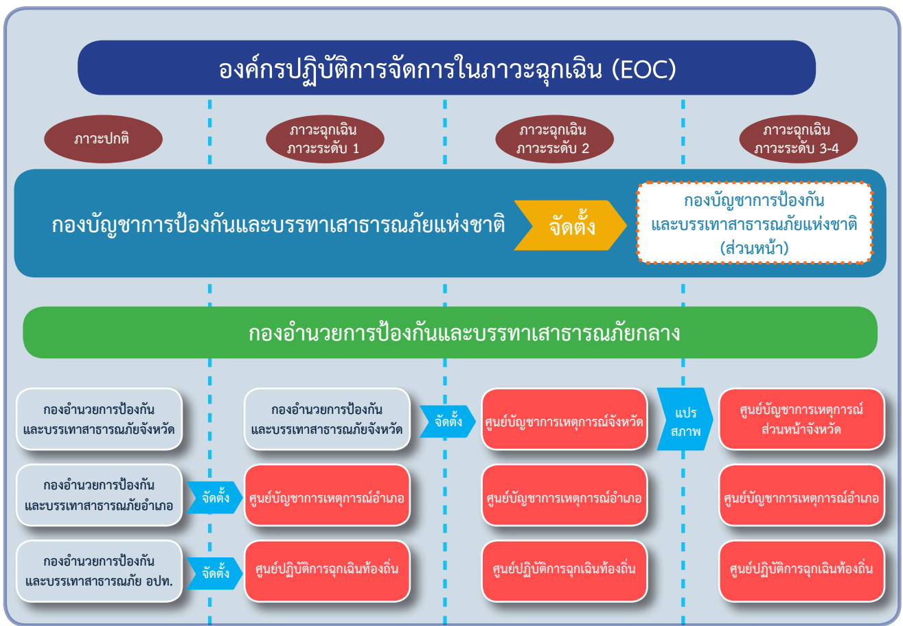
แผนภาพที่ ๒-๓ การจัดตั้งองค์กรปฏิบัติการจัดการในภาวะฉุกเฉิน (EOC)

ในกรณีการจัดการสาธารณภัยขนาดเล็ก (ระดับ ๑) และการจัดการสาธารณภัยขนาดกลาง (ระดับ ๒) ให้กองอำนวยการป้องกันและบรรเทาสาธารณภัยกลางรับผิดชอบอำนวยการ ประสาน การปฏิบัติ ประเมินสถานการณ์ และสนับสนุนการสั่งการจากกองบัญชาการป้องกันและบรรเทาสาธารณภัยแห่งชาติ รวมทั้งติดตาม เฝ้าระวังสถานการณ์ วิเคราะห์สถานการณ์ รายงาน และเสนอความคิดเห็นต่อผู้บัญชาการป้องกันและบรรเทาสาธารณภัยแห่งชาติ หรือนายกรัฐมนตรี เพื่อตัดสินใจยกระดับเป็นการจัดการสาธารณภัยขนาดใหญ่ (ระดับ ๓) หรือการจัดการสาธารณภัยร้ายแรงอย่างยิ่ง (ระดับ ๔)