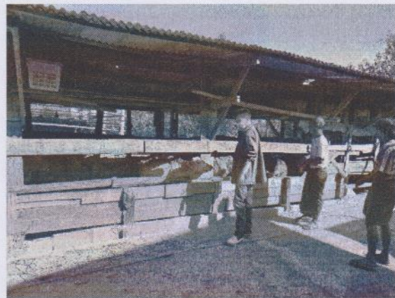
รูปภาพประกอบโครงการสำรวจและขึ้นทะเบียน : ดำเนินการสำรวจประชากรโค-กระบือในแต่ละหมู่บ้าน, จำนวนสัตว์ที่ติดเบอร์หู/ไม่ติดเบอร์หู และประวัติการฉีดวัคซีน